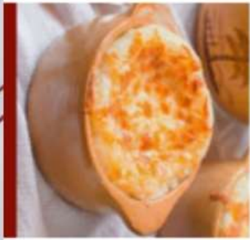
Sonso de Yuca - Traditional B...