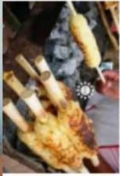
Sonso Yuca - Santa Cruz - B... boliviaturismo.com