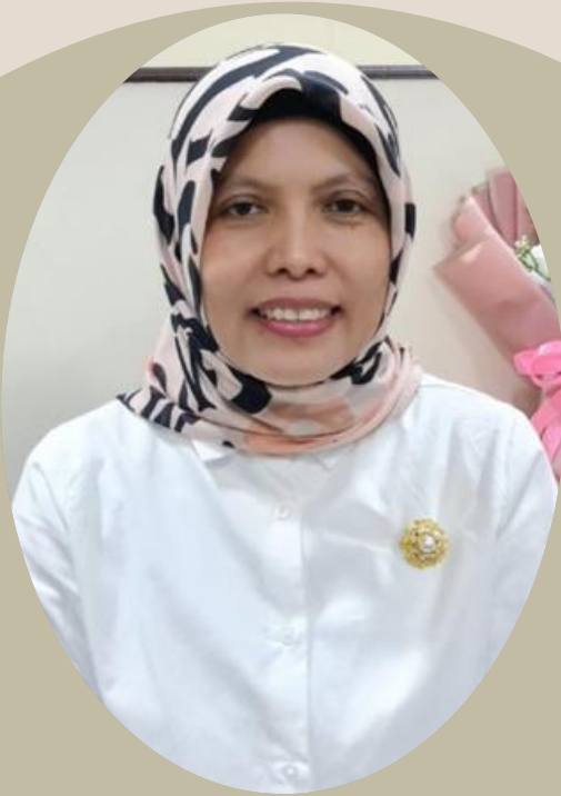
ESTUTI FH, SE., MM president