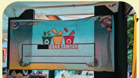
TEMUKAN BANK SAMPAH TERDEKAT