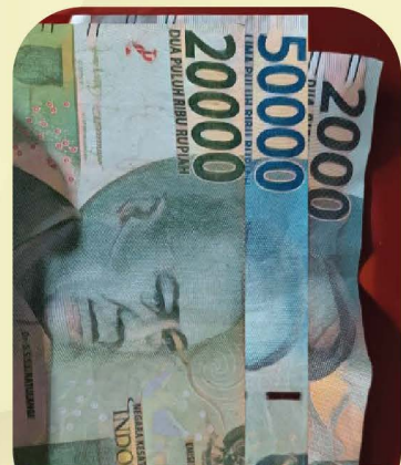
TUKAR MENJADI UANG

SAMPAH MENUMPUK? ISI DOMPET MU MENJADI PENUH!!!