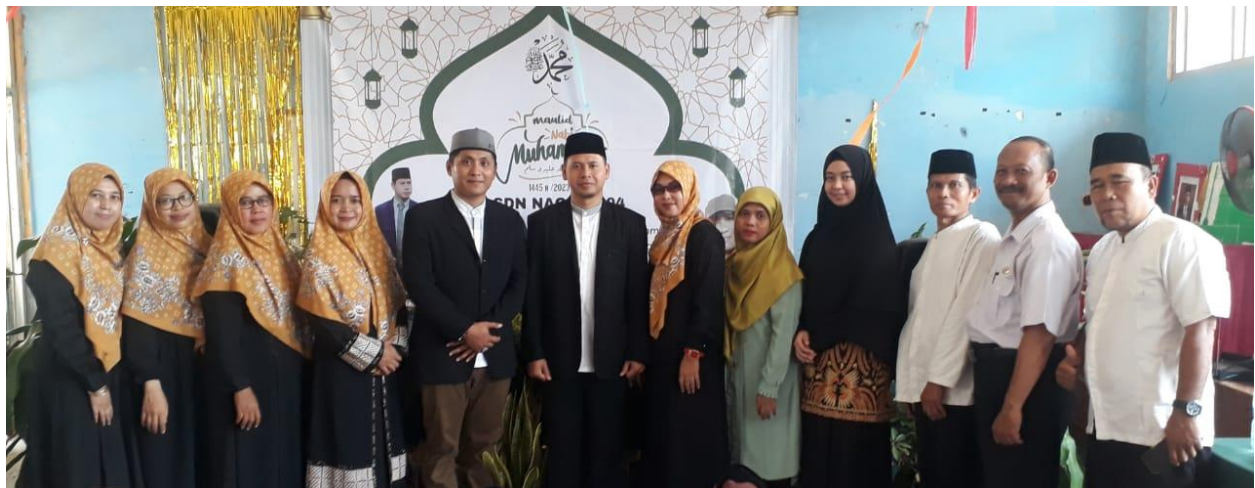
SDN Nagrak 04 Kp. Cohak Desa Nagrak, Gunung Putri, Bogor.