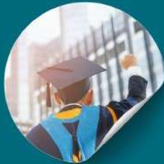
Pendidikan yang Relevan