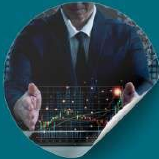
Pemahaman Teknologi dan Inovasi