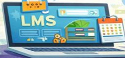
LEARNING MANAGEMENT SYSTEM (LMS)